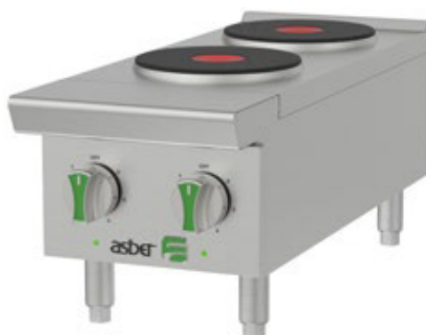
AEHP E 2 12 EM

Consultar al fabricante los datos de potencia y de amperaje.